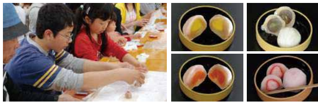
いちご・みかん・巨峰・マンゴーで、お客様に「フルーツ大福」を作っていただきます。季節のフルーツを白餡で覆い、ご用意したお餅に包んで頂きます。