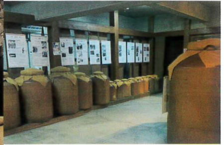
マルス優貴熟蔵(かめ熟成ワイン)