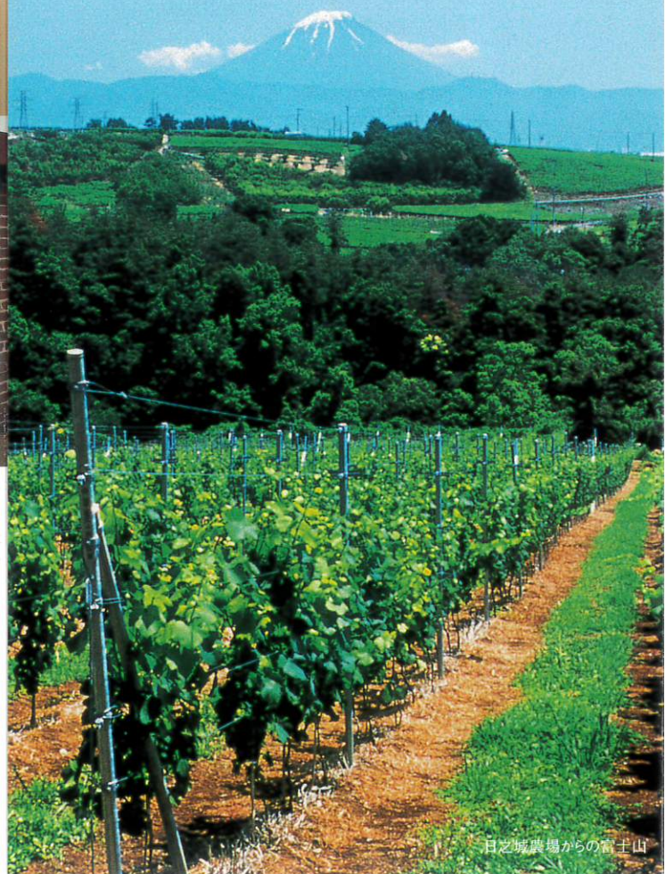
日之城農場からの富士山