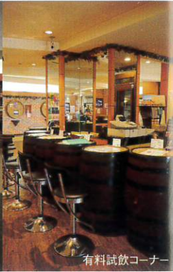
有料試飲コーナー