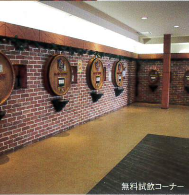
無料試飲コーナー