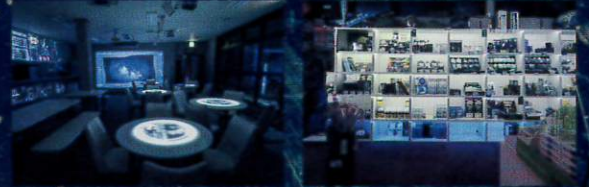
■ STAR VILLAGE CAFÉ BY NAKED ■ STAR SHOP