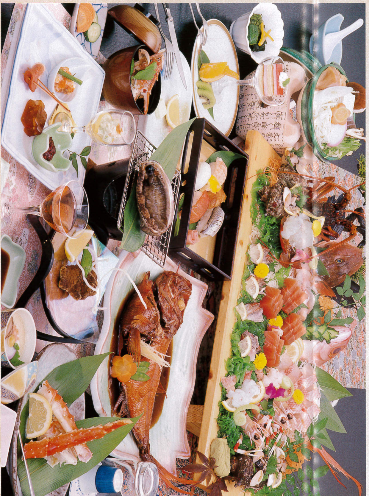
黒潮の膳 3,000円 お一人様一泊二食付(税別)