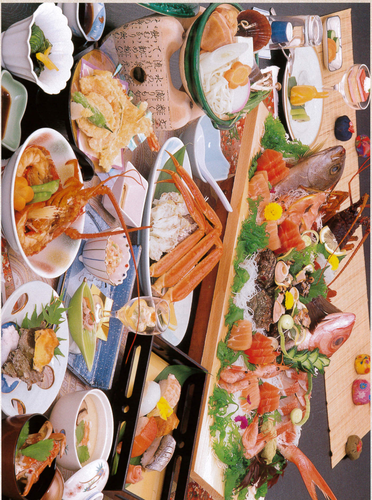
夕風の膳 10,000円 お一人様一泊二食付(税別)

海の幸満載の日替り姿造り2種がついた、お魚好きにはたまらない、2つのプランをご用意しました。