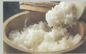
KAMAKURA WASAI YAKURA