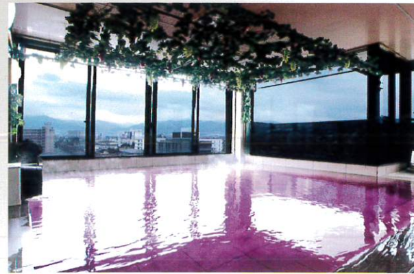
展望ワイン風呂(御婦人)