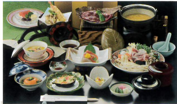
※季節により、お料理の内容は異なります。

山梨、石和ならではの地元の食材にこだわって一品一品を 丁寧にお出し致しております。お客様のニーズに合ったお 食事処、カラオケの楽しめるクラブ、厳選された品揃えの 売店、旬なおもてなしがここにあります。