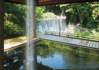
滝見乃湯(露天風呂)