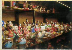
郷土玩具(木村家二階)

古くより使われた薬算笥、船算笥、水屋算笥など、日本一のコレクション数を誇る多種多様な時代算笥がずらりと並んでいます。