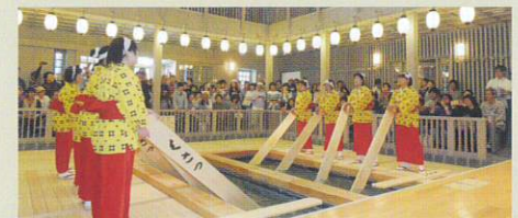
当館から徒歩5分の熱乃湯では、「湯もみと踊り」ショーを毎日行っております。草津温泉の伝統を肌で感じることができます。