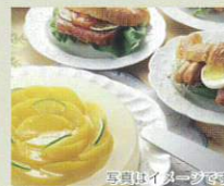
写真出イメーヂです