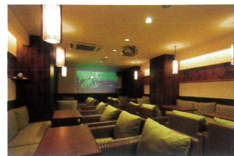
二次会処WA喜あいあい