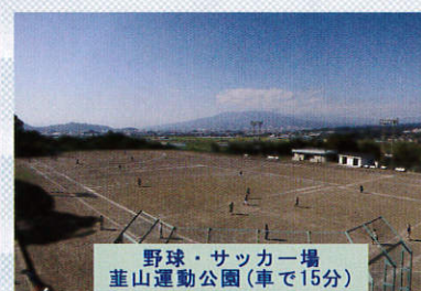
野球・サッカー場 葦山運動公園(車で15分)