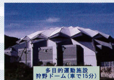
多目的運動施設 狩野ドーム(車で15分)