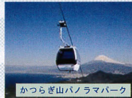
かつらぎ山パノラマパーク