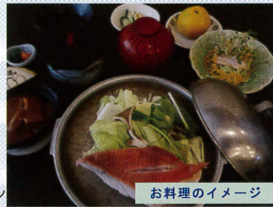
お料理のイメージ