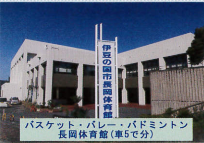
バスケット・バレー・バドミントン 長岡体育館(車で5分)

周辺にはサッカー・野球グラウンド、テニスコート、体育館、音楽ホールなど数多くの公共施設がございます。予約手配も承ります。各施設は2~6ヶ月前が予約開始日です。お早めにご相談ください。