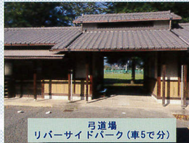
弓道場 リバーサイドパーク(車で5分)