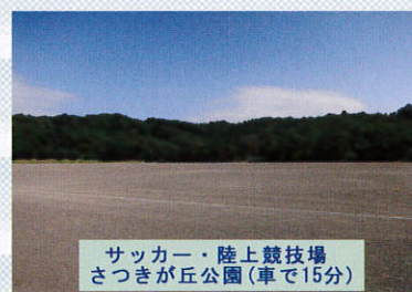
サッカー・陸上競技場 さつきが丘公園(車で15分)