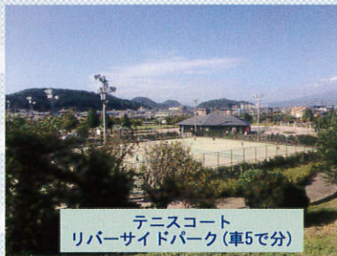
テニスコート リバーサイドパーク(車で5分)