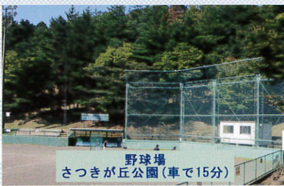
野球場 さつきが丘公園(車で15分)