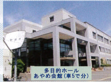
多目的ホール あやめ会館(車で5分)