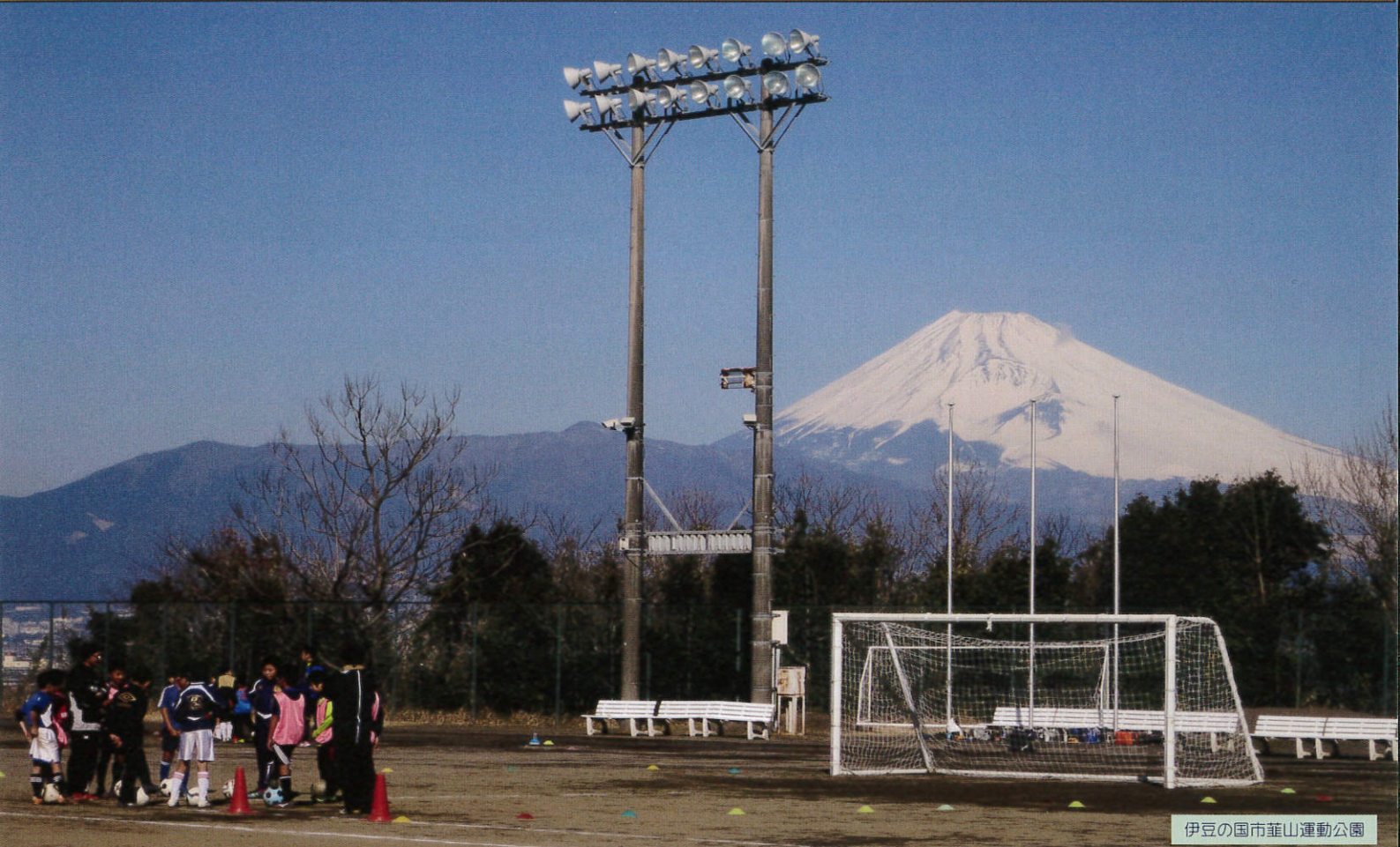
伊豆の国市葦山運動公園