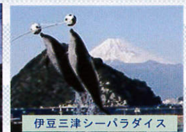
伊豆三津シーパラダイス