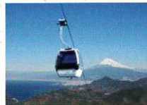
葛城山パノラマパーク