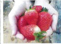
いちご狩りセンター