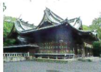
伊豆国総社三島大社