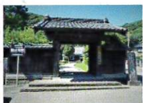
願成就院(頼朝・運慶)