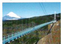
三島スカイウォーク