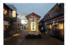
沼津港八十三番地