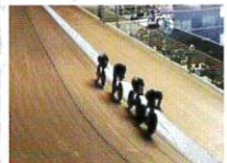
東京五輪公式競技場 サイクルスポーツセンター