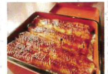
富士の湧水三島饅頭