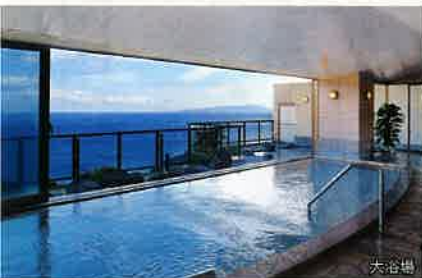
浴槽から海を望む開放感あふれる大浴場です。

※別途料金：4階露天風呂付き客室 60,000円（税別）× 2室 6階露天風呂付き客室 80,000円（税別）× 1室