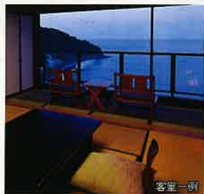
全ての客室から眼下に海が眺められます。