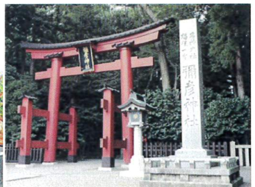
弥彦神社迄徒歩1分弱。是非「朝参り」へ！