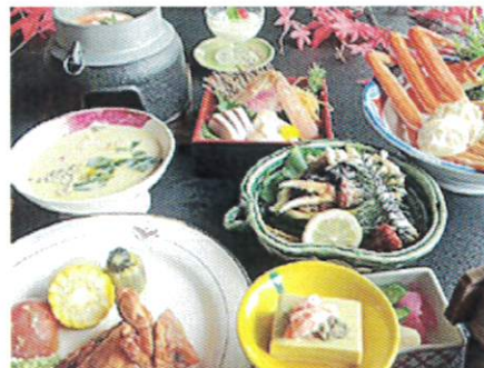
蟹三味の夕食はお1人様2,000円増