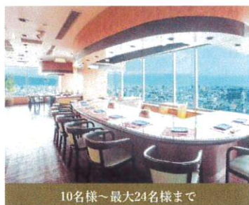
10名様～最大24名様まで