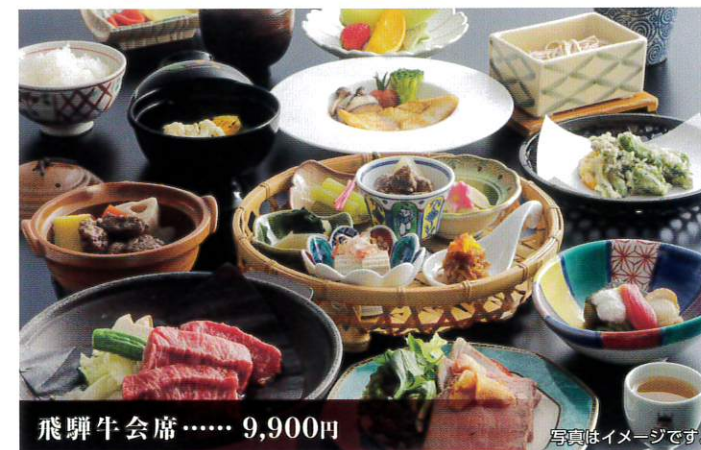
飛驒牛会席 …… 9,900円

飛驒牛は「朴葉味噌焼き」で。天ぷらや飛驒荘川そばなど高山の和食を味わっていただく御膳です。