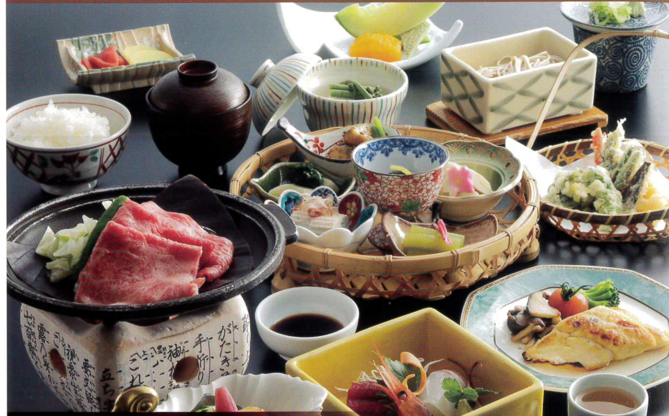
飛驒牛布袋(ほてい)御膳…… 5,720円