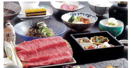
飛驒牛しゃぶしゃぶ膳..... 3,520円

飛驒牛陶板焼80グラムをメインとし、 旬の素材で内容の変わる前菜やお造りな ど「和」と「飛驒牛」を楽しめます。