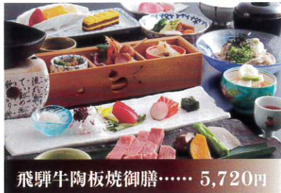
飛驒牛陶板焼御膳..... 5,720円

日本庭園を望む和食レストランにて、 飛驒高山名物の朴葉味噌に牛肉を絡めて焼 く牛朴葉味噌焼をお楽しみ下さい。