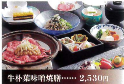
牛朴葉味噌焼膳..... 2,530円

日本庭園を望む和食レストランにて、 飛驒高山名物の朴葉味噌に牛肉を絡めて焼 く牛朴葉味噌焼をお楽しみ下さい。