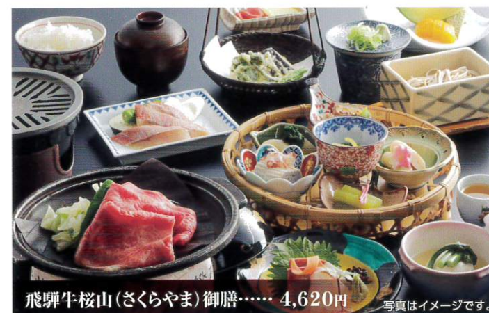
飛驒牛桜山(さくらやま)御膳…… 4,620円