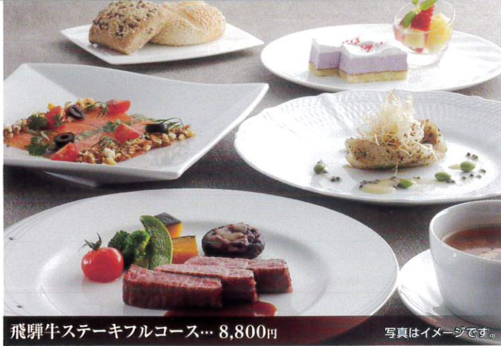
飛驒牛ステーキフルコース... 8,800円