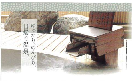
日帰り温泉。 ゆったり、のんびり、 ゆったり、のんびり、 ゆったり、のんびり、

檜と岩の趣の異なるふたつの露天風呂は、どちらも四季折々の自然を肌で感じられる情緒豊かな空間。 檜風呂はボタンを押せばジャグジーに、岩風呂は夜のライトアップが一興です。