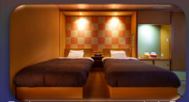
【溪谷ツイン和洋室】 ※14室限定