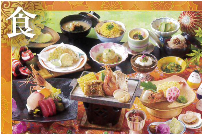
宴会御膳 9,900円 (消費税込)~