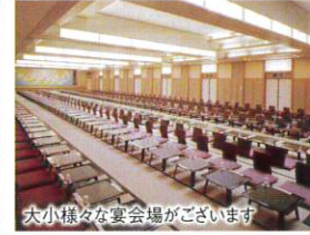
大小様々な宴会場がございます

天然温泉 (加水・循環ろ過) ■泉質 ナトリウム・カルシウム-硫酸塩・塩化物泉 (低張性・弱アルカリ性・高温泉) ■効能 神経痛、筋肉痛、慢性消化器疾患