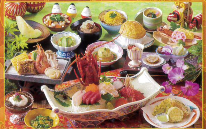
極味御膳 13,200円 (消費税込)~