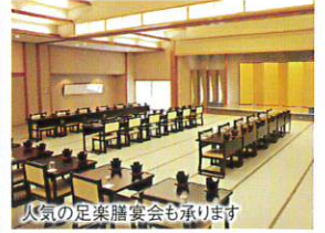
人気の足楽膳宴会も承ります