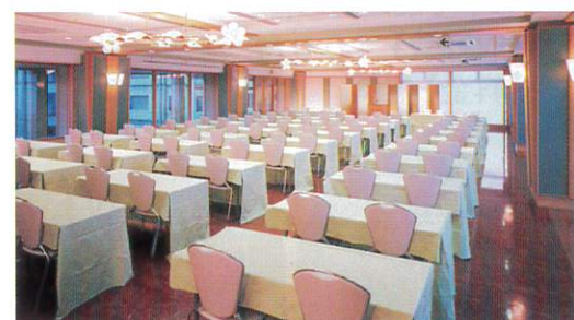
コンベンションホール清流 (350㎡)