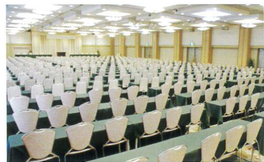
コンベンションホール鳳凰 (670㎡) スクール形式: 500席 / シアター形式: 930席