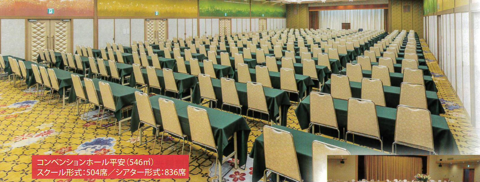
コンベンションホール平安 (546㎡) スクール形式: 504席 / シアター形式: 836席