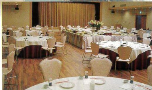
コンベンションホール / 大宴会場 桜 (525㎡) スクール形式: 400席 / シアター形式: 594席、 イス・テーブル形式: 288名様、和宴会場: 318畳