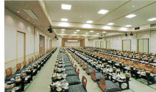
コンベンションホール / 大宴会場 竹 (450㎡) スクール形式: 360席 / シアター形式: 520席、 スクール形式: 360名様、和宴会場: 272畳