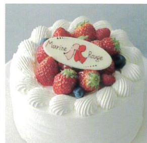
アニバーサリープラン(ケーキ・花束)も承ります。詳しくはお問い合わせください。