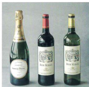
ワイン・スパークリング 4,800円～