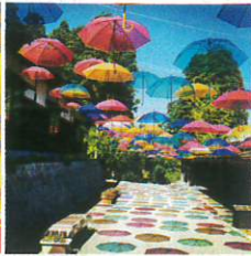
アンブレラスカイ