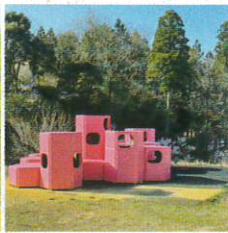
ピンクのモニュメント