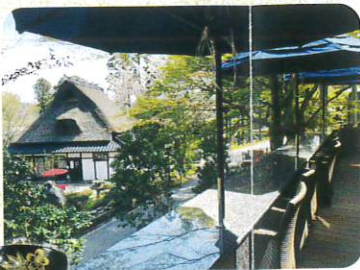
村内を一望できる森のテラス