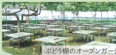
ぶどう棚のオープンガーデン