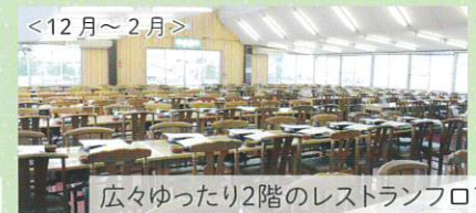
広々ゆったり2階のレストランフロア