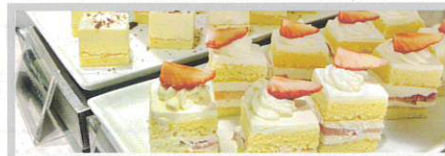
ショートケーキやパティシエ特製のデザートをご用意

※サービス料15%と消費税10%が含まれております。 ※子供・幼児が4割以上の場合は大人料金となります。 ※平日ランチ20名様以下のご利用は、20名様料金をギャランティさせていただきます。※50名様以上の場合は30分の時間差をつけてのご利用をお願いします。