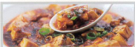
奥深い味わいの醬と香り豊かな花山椒が美味しい重慶飯店の名物料理麻婆豆腐!

ローズホテル横浜の洋食と重慶飯店の中華料理が味わえるランチバイキング。お客様の目の前で仕上げるメインディッシュ、本格四川麻婆豆腐にエビチリなど約30種類。横浜中華街のホテルならではのバイキングをどうぞお楽しみ下さい。メニューは季節毎に替わりますので、メールニュースやHPからご確認ください。