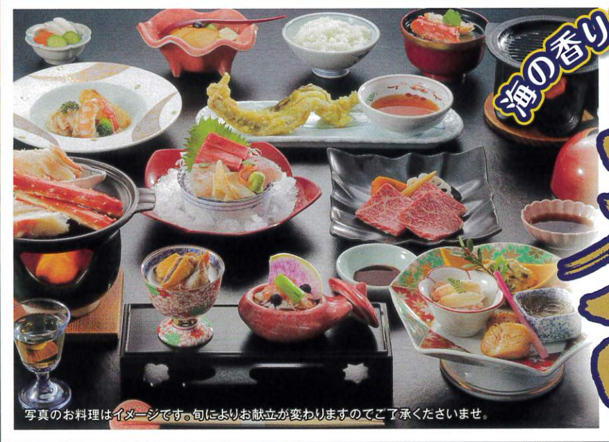
写真のお料理はイメージです。旬によりお献立が変わりますのでご了承くださいませ。

●お一人様1泊2食付の料金です ●1室4名以上 ●お部屋は西風館ご利用 ●お部屋は定員にてご利用いただきます *入湯税150円は別途となります