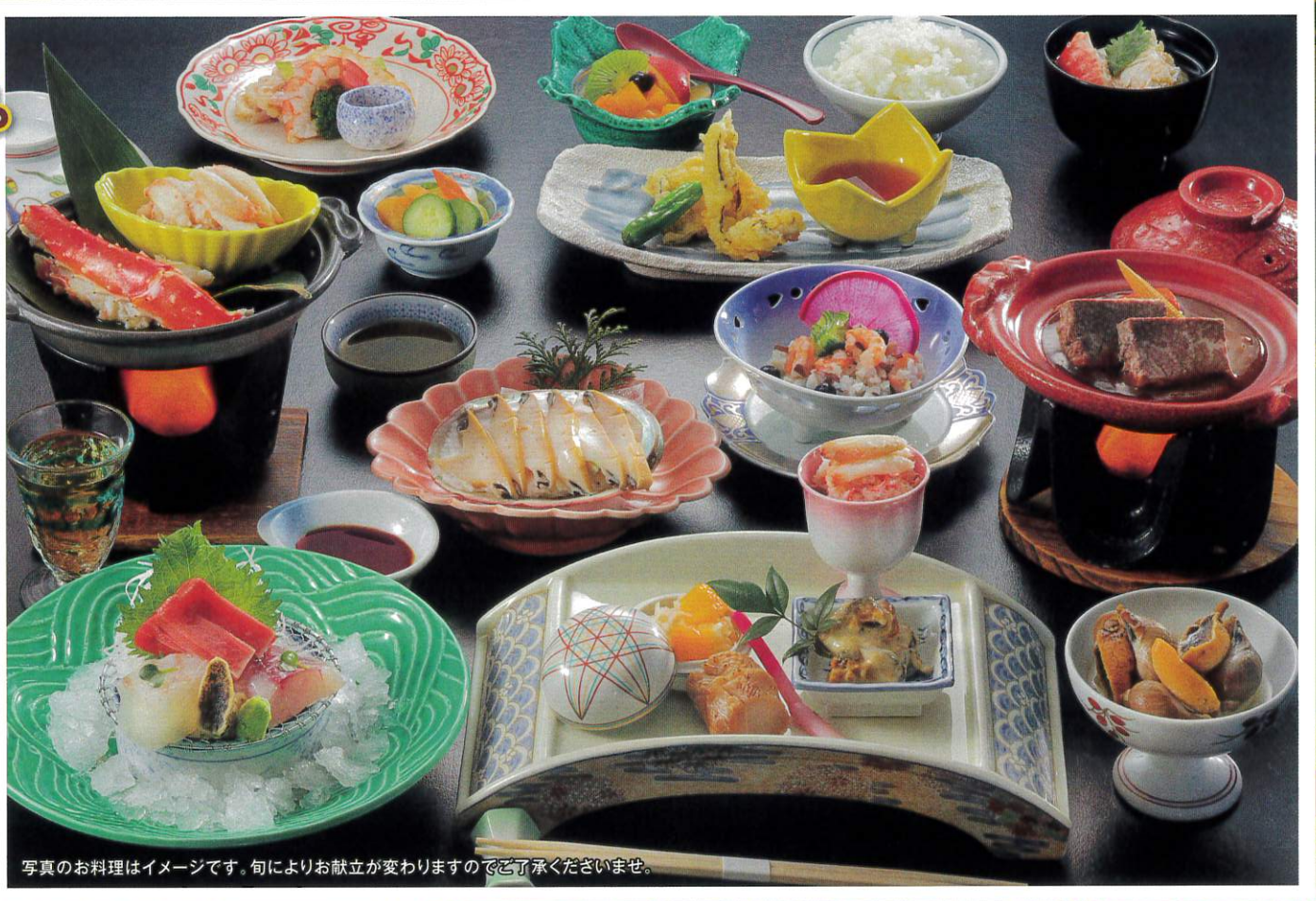
写真のお料理はイメージです。旬によりお献立が変わりますのでご了承くださいませ。