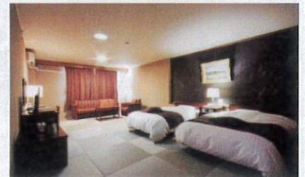
和室ベッドツイン