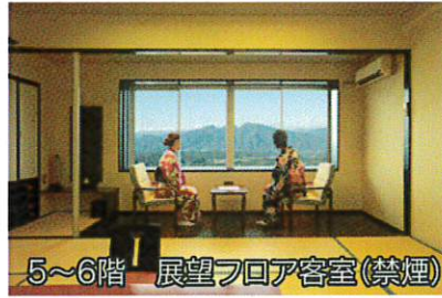
5~6階 展望フロア客室(禁煙)

立地は、石段街から歩いて5~6分(お客様には10分と説明)ですが、高台にあり、大浴場やお部屋から上州の山々の素晴らしい景色が望めます。