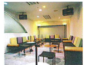
2F 個室カラオケルーム