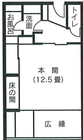
広縁あり 12.5 畳

特色② 基本12.5畳(定員5~6:部屋タイプによる)の広いお部屋、全室バス・トイレ(シャワートイレ)付き。(定員4名の10畳のお部屋が2つあります。)