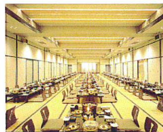
大宴会場 榛名 (208 畳)

特色③ 会議室は4分割出来、1区画のスクール形式24名。wifiも完備しております。2次会会場は50名収用のカラオケクラブと24名収用の個室カラオケルームがございます。