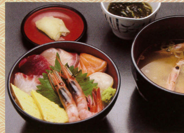
ちらし丼 1,200 (税別) 円