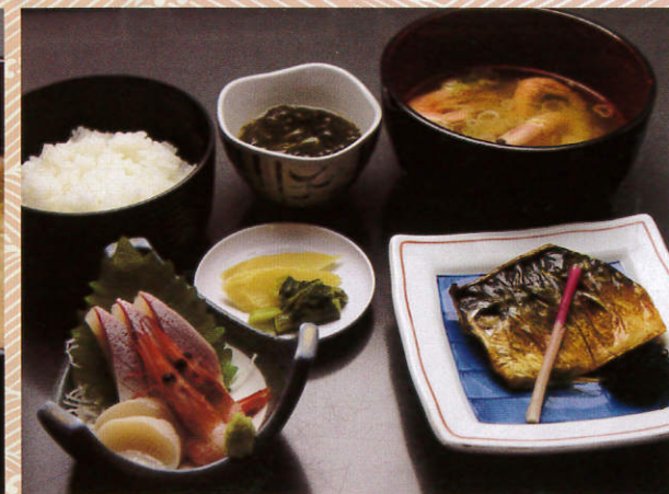
番屋定食 1,000 (税別) 円