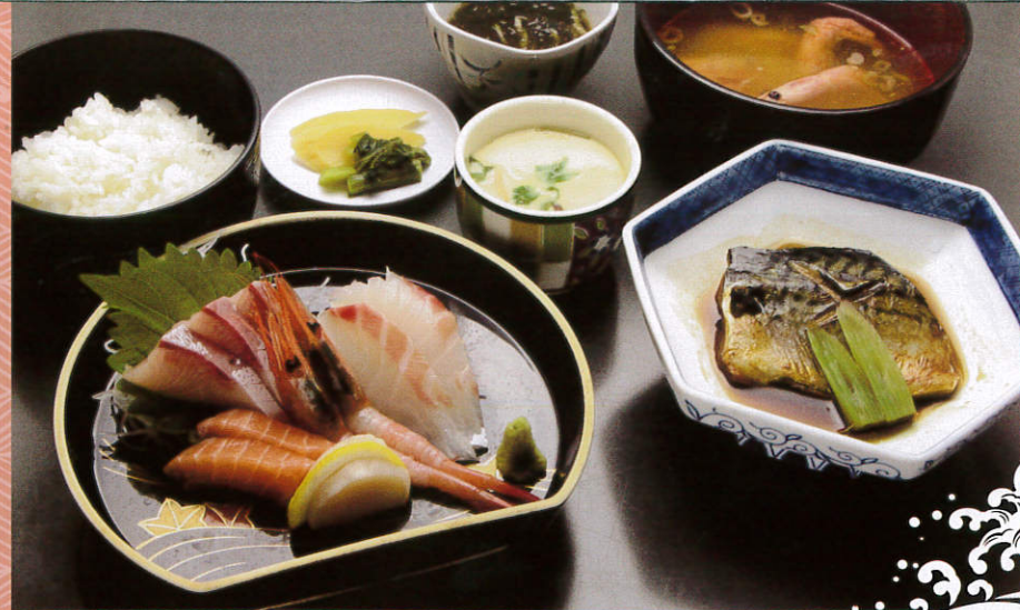
さざなみ定食 1,500 (税別) 円