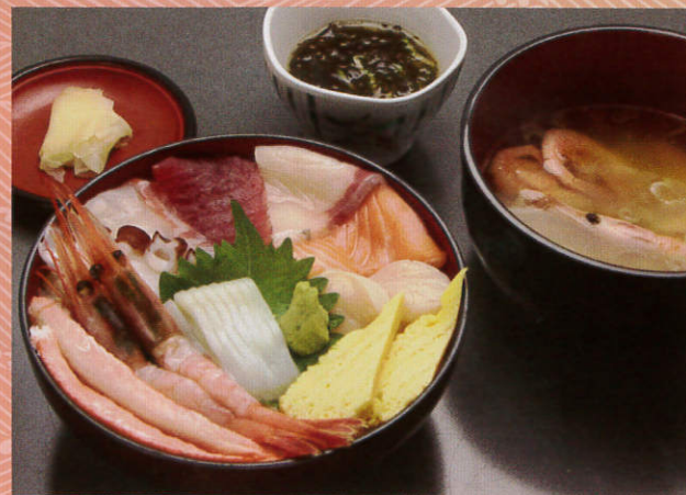
海の幸丼 1,500 (税別) 円