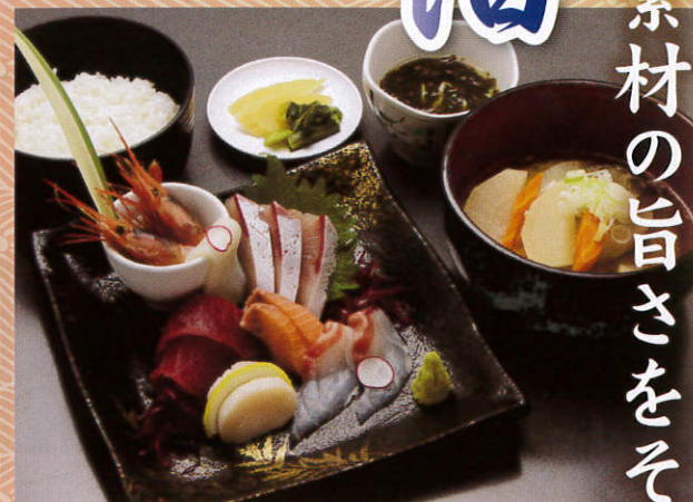
お刺身定食 2,000 (税別) 円