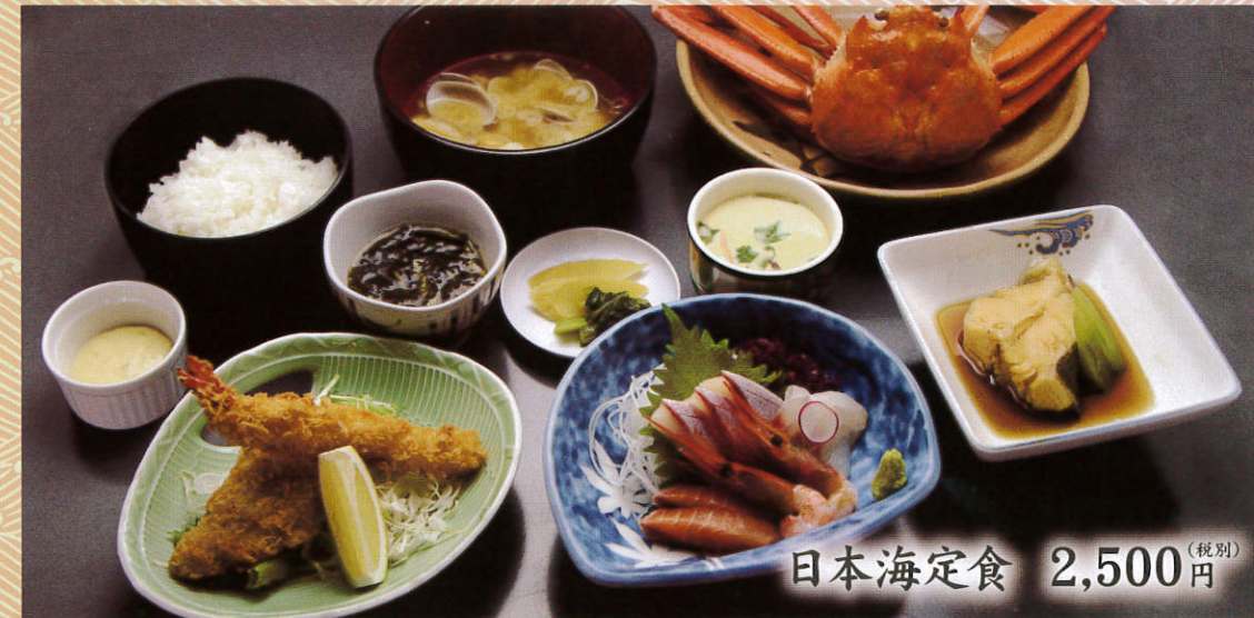
日本海定食 2,500 (税別) 円