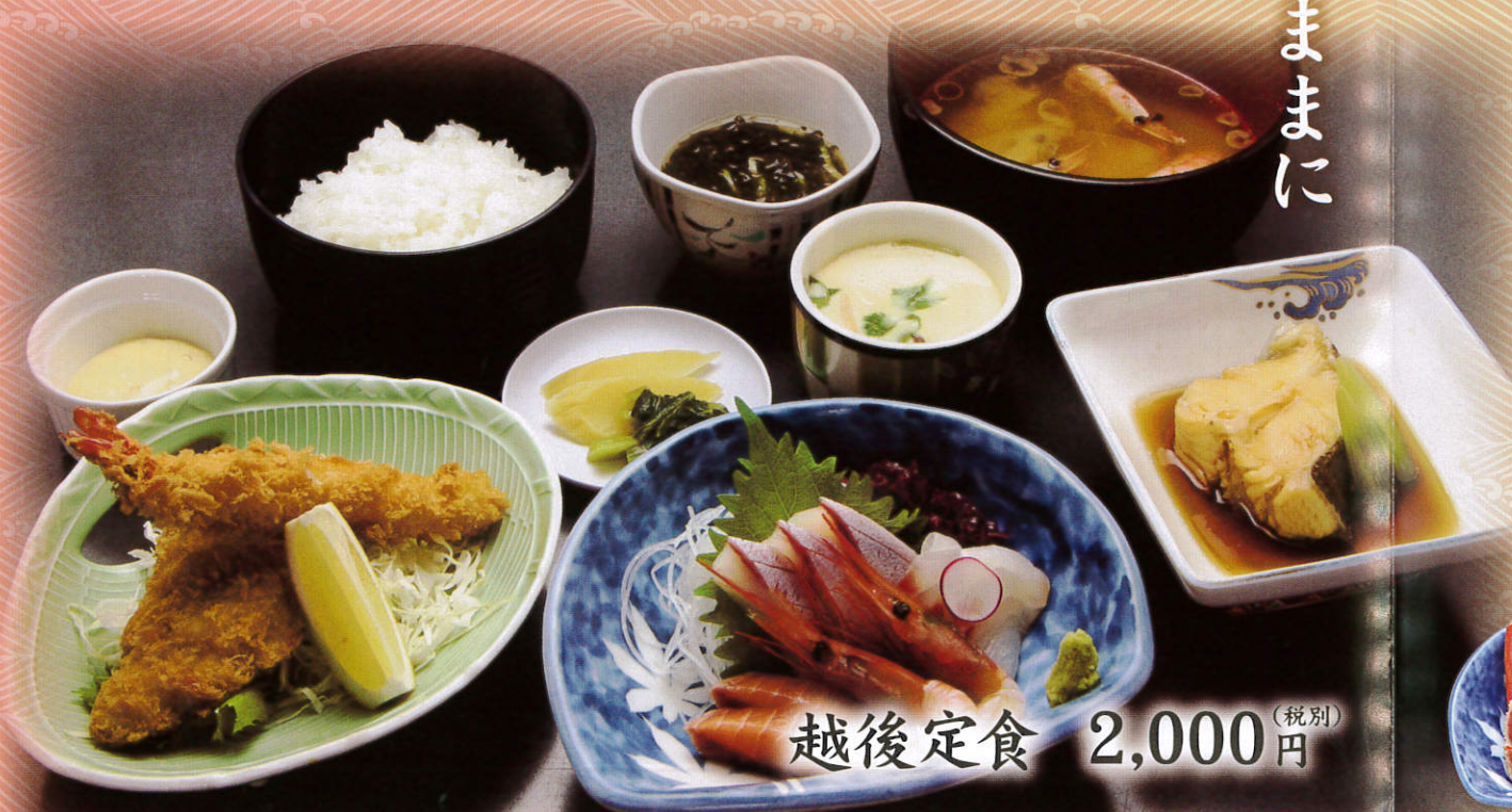
越後定食 2,000 (税別) 円