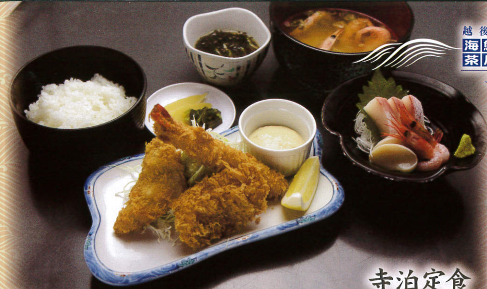
寺泊定食 1,250 (税別) 円