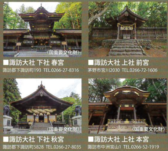
■諏訪大社 下社 春宮 諏訪郡下諏訪町193 TEL.0266-27-8316