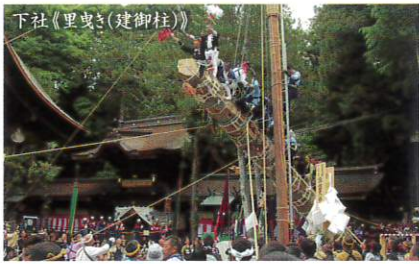
下社《里曳き(建御柱)》

新緑のまぶしい5月中旬、町中が華やかな雰囲気に包まれます。神賑わいの長持ち、騎馬行列、花笠踊りなどが繰り広げられます。御柱は注連掛から春宮、秋宮へ向かい、「冠落し」を行って、各神社の境内に建てられ、山の樫の大木は神となるのです。