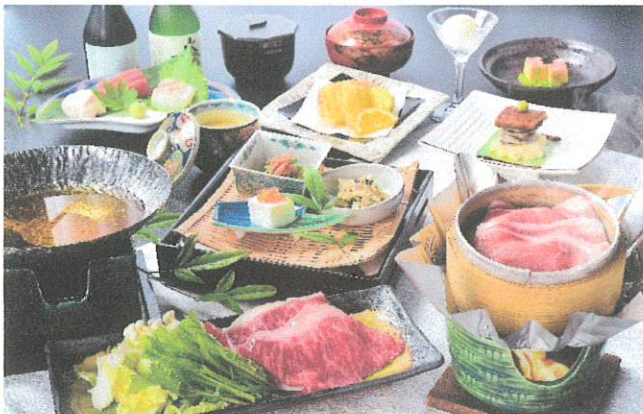
春夏秋冬会席 料理イメージ

信州割 SPECIAL 割引対象地域の方はご活用下さい。 NOZAWARI クーポンとの併用も可能です。