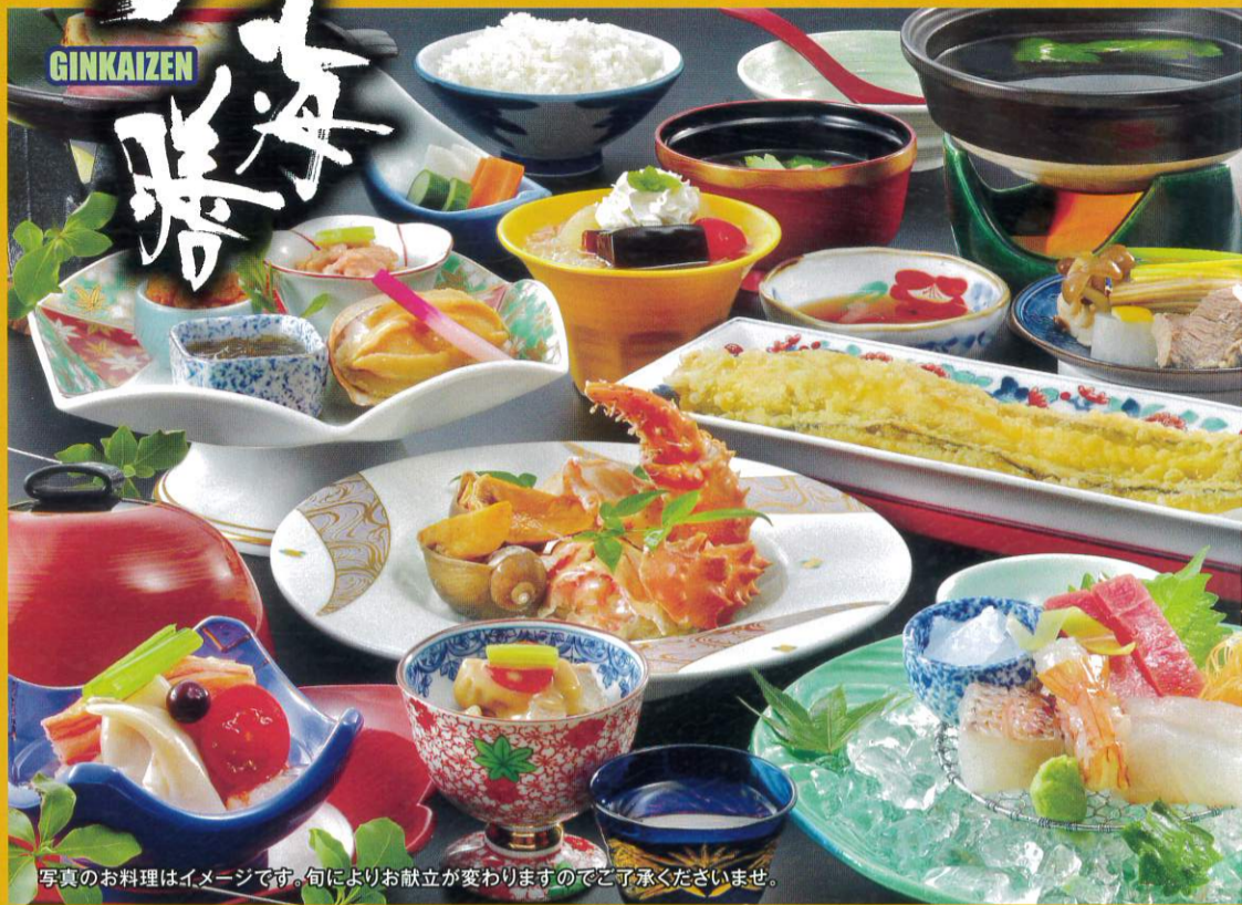
写真のお料理はイメージです。旬によりお献立が変わりますのでご了承くださいませ。