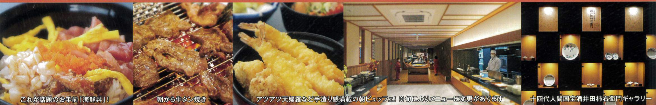
これが話題のお手前「海鮮丼」!

和ダイニング「徒季和」、話題の極上朝食ビュッフェもますますパワーアップ! ※イス・テーブルの和膳形式も承ります