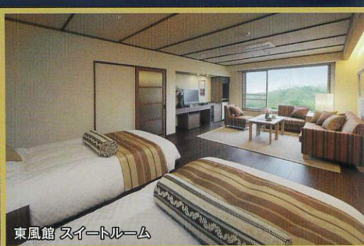
東風館 スイートルーム