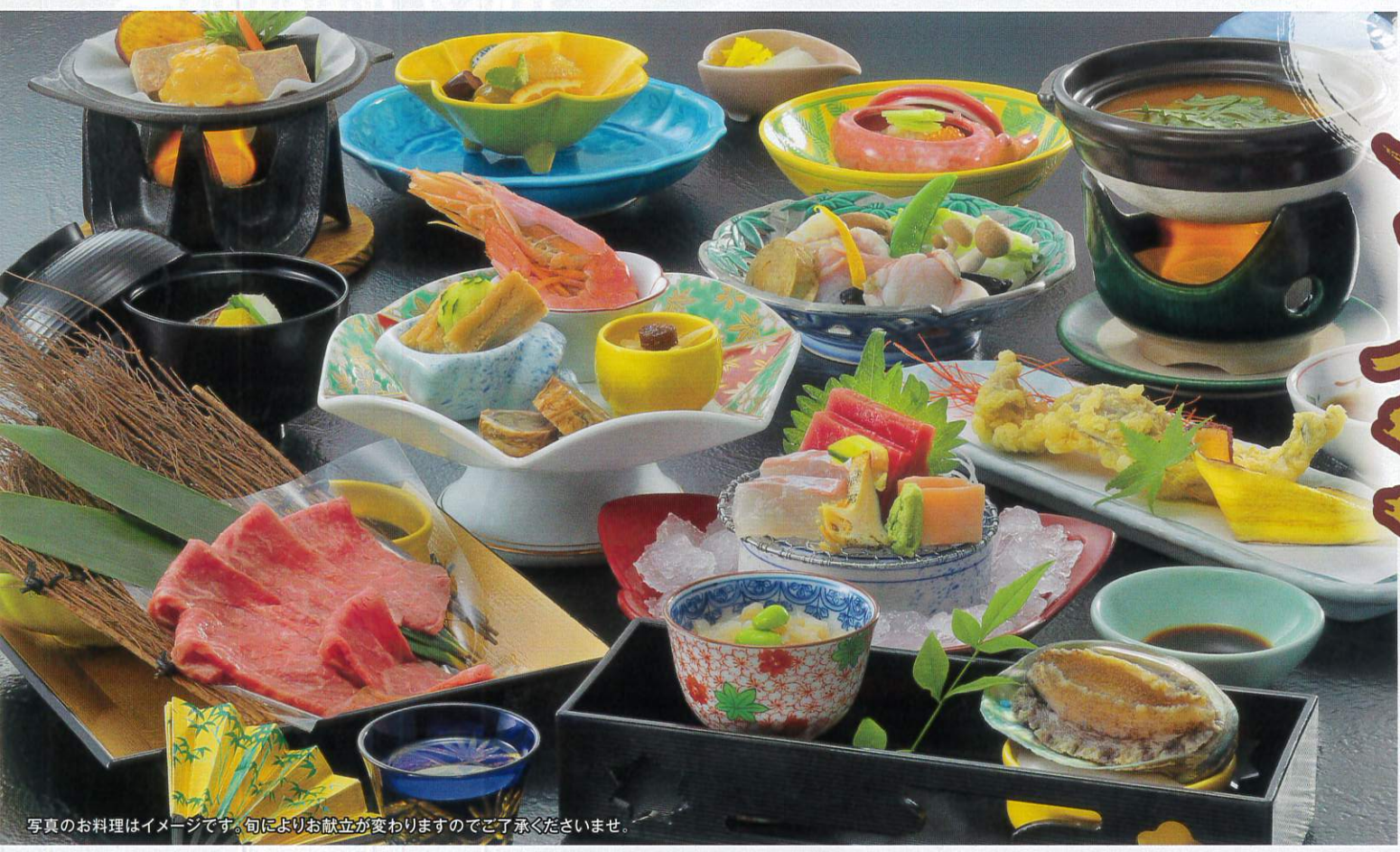
写真のお料理はイメージです。旬によりお献立が変わりますのでご了承くださいませ。

◆お部屋は定員利用 ◆11月・12月は表示金額+1,000円 ●1室4名様以上 ●お部屋は西風館ご利用*入湯税150円は別途となります