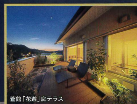
蒼館「花遊」庭テラス