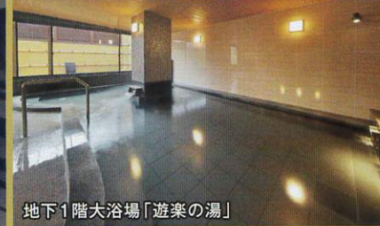
地下1階大浴場「遊楽の湯」