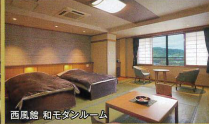
西風館 和モダンルーム