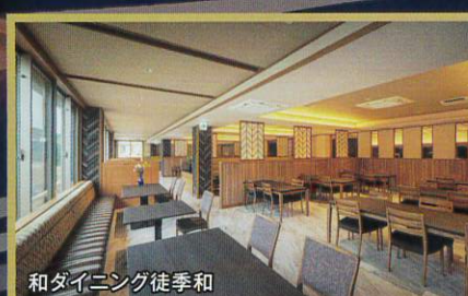
和ダイニング徒季和

*土曜日は3,000円アップとなります *11月・12月は表示金額+1,000円 *上記お値段は1室お一人様の料金です *7名様以上はテーブルが分かれる場合がございます *入湯税150円は別途となります