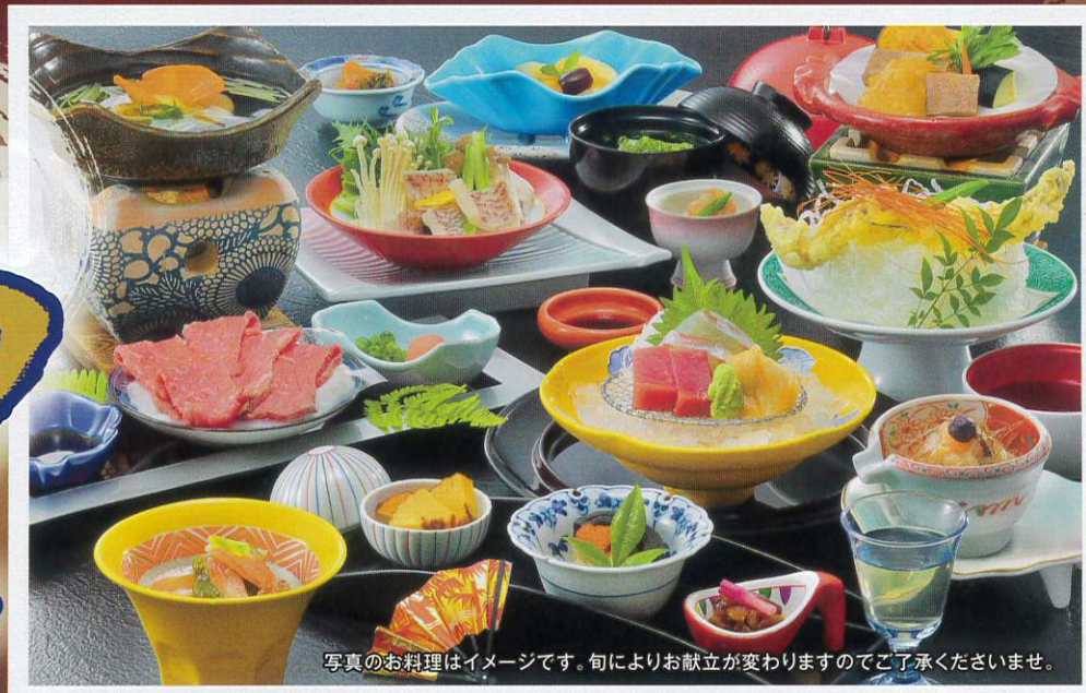
写真のお料理はイメージです。旬によりお献立が変わりますのでご了承くださいませ。