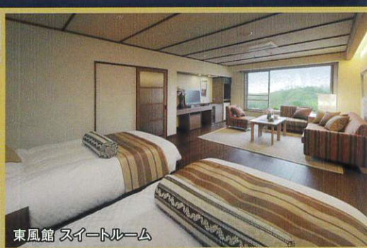
東風館 スイートルーム