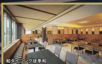
和ダイニング 徒季和

*土曜日は3,000円アップとなります *11月・12月は表示金額+1,000円 *上記お値段は1室お一人様の料金です *7名様以上はテーブルが分かれる場合がございます *入湯税150円は別途となります