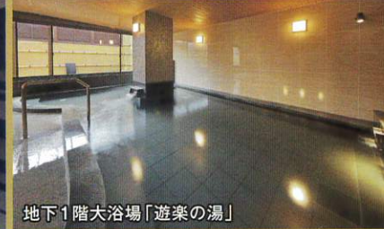
地下1階大浴場「遊楽の湯」