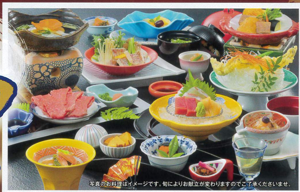
写真のお料理はイメージです。旬によりお献立が変わりますのでご了承くださいませ。