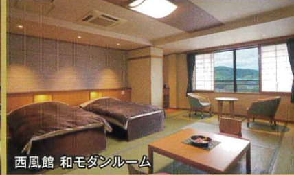
西風館 和モダンルーム