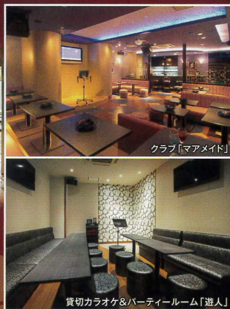
クラブ「マアメイド」