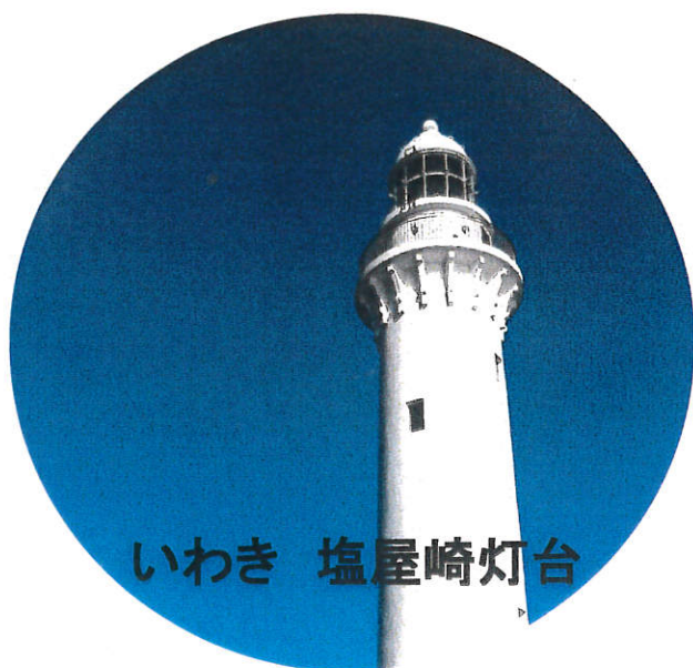
いわき 塩屋崎灯台

団体様・小グループ様の 御昼食メニューです。 お問い合わせ・御相談は TEL:0246-55-5656 までお気軽に御連絡下さ いませ。