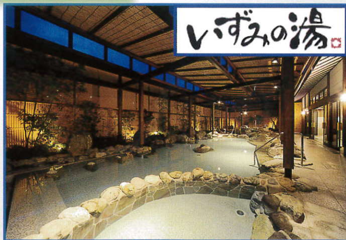
(地域最大級の露天風呂)