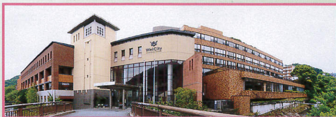
施設全景(ホテル 大小宴会場 休憩室 売店 レストラン)