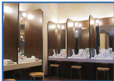
(アメニティの整った洗面台)