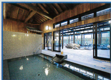
(内風呂より見た露天風呂)