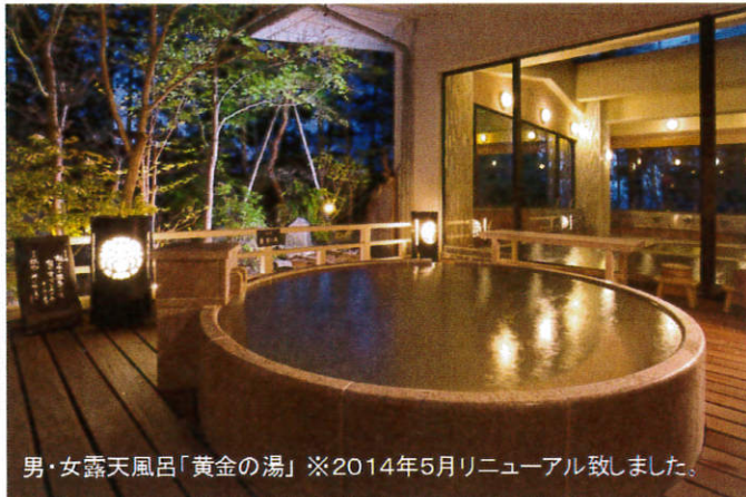
男・女露天風呂「黄金の湯」※2014年5月リニューアル致しました。